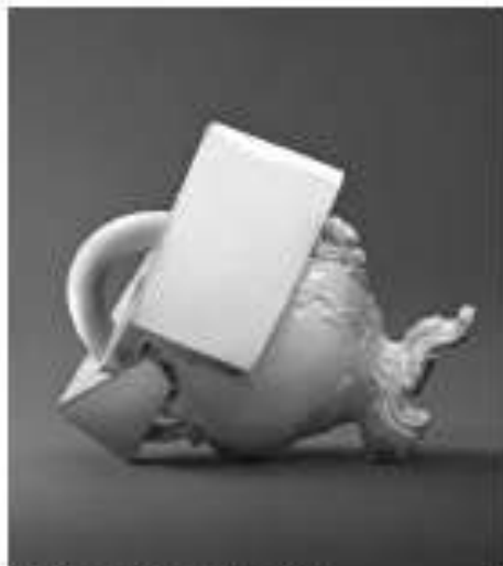
Paolo Pollonara: 'La métamorphose forcée', 2011. Gietstuk en geglazuurmeerde originele stukken uit 1900 afkomstig uit de manufacture Barettoni in Nove (Italië). Esence, 45 x 19 x 17 cm. Te zien op de expositie 'Tendances' van The Ceramic Event.

The Ceramic Event St.-Denijsplein (keramiekmarkt) Les Ateliers Galerie de l'Ô Rue de l'Eau 56a (tentoonstelling) Vorst (Brussel) www.galeriedelo.be 19 en 20 mei